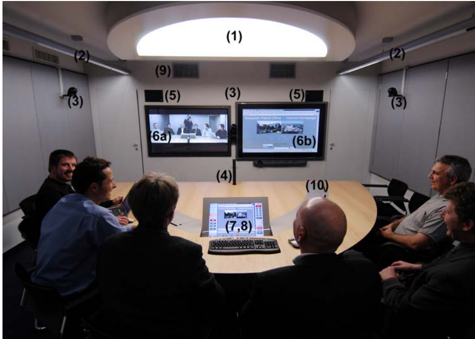
Abbildung 3: Beispiel eines optimal ausgestatteten Videokonferenzraums im Europäischen Patentamt für bis zu 10 Teilnehmer.